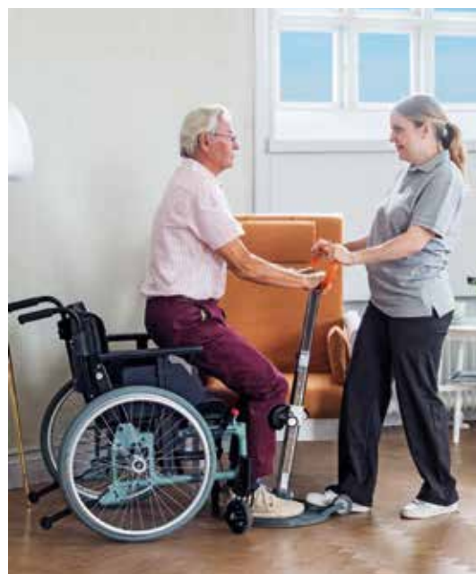
Un transfert en toute sécurité qui permet un contact visuel et une bonne communication : rassurant pour les deux participants.