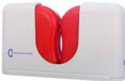
Réf. : DROPMENOT_WR