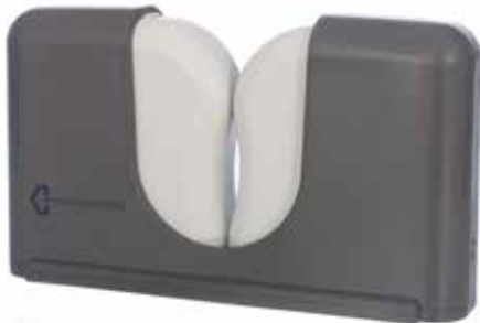
Réf. : DROPMENOT_DGW