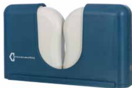
Réf. : DROPMENOT_BW