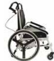
Accoudoirs sport, vue de côté