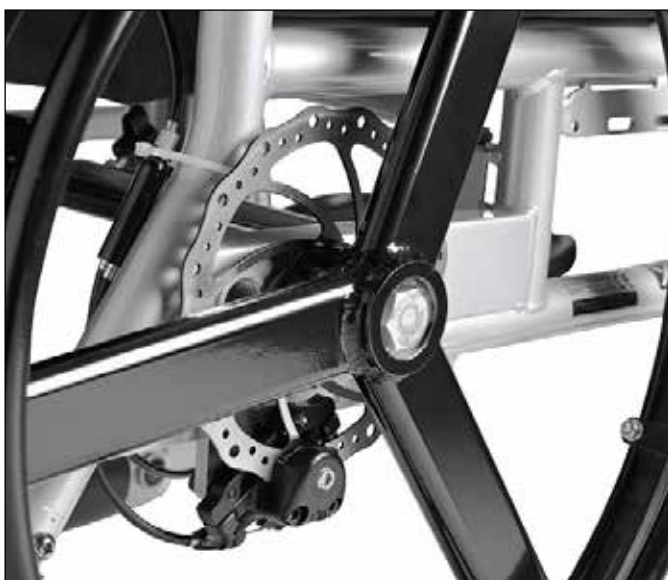
Frein à disque