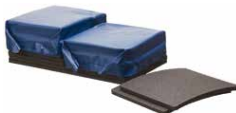
Cellules d'eau et cales