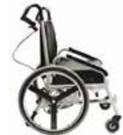
Accoudoirs sport, vue de côté