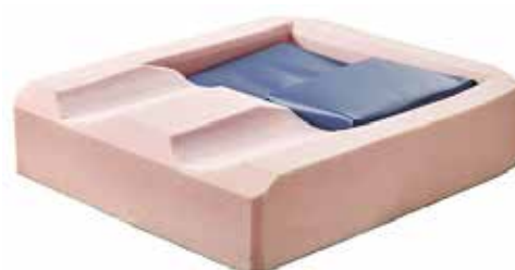
La hauteur des cellules d'eau est ajustable individuellement à l'aide de deux cales.