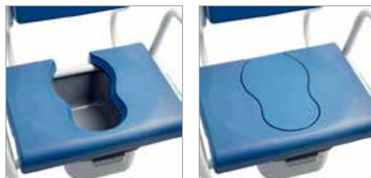
Une nouvelle assise avec une partie amovible pour transformer la chaise de douche en chaise percée (bassin livré en standard).