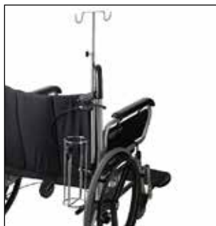
Tige porte-sérum et porte-bouteille à oxygène