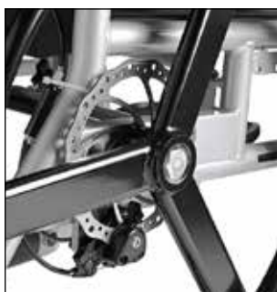
Frein à disque