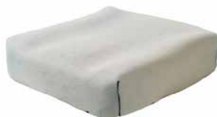
Housse en mousse