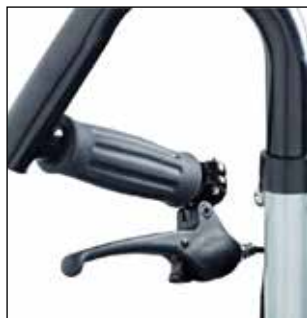
Frein sur poignée de poussée