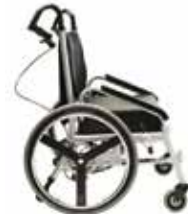
Accoudoirs sport, vue de côté

Minimaxx avec moteur est pourvu d'un moteur puissant qui assiste l'accompagnateur pour pousser la chaise sans effort. Cela facilite le déplacement d'un patient bariatrique. Le soignant évite grâce au moteur les risques de tension au niveau des épaules et des poignets.