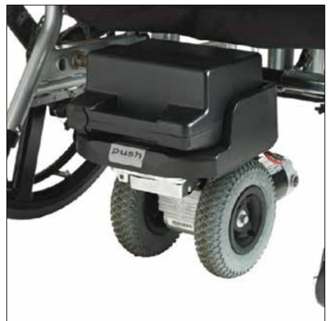
Moteur de poussée